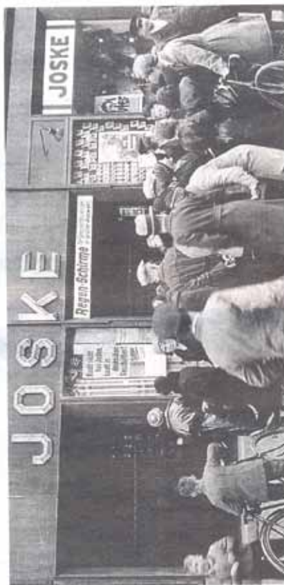
Kaufhaus M. Joske & Co während des Boykotts 1933.

Eröffnung Kaufhaus Joske, morgen, 19 Uhr, Karl-Heine-Straße 43