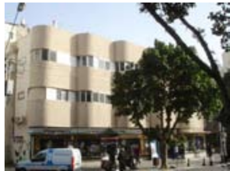
Unten: Ein Wohnhaus, welches als Eckhaus die klassisch runde Form aufweist. Heute ist es von Büschen und Bäumen völlig überwuchert.