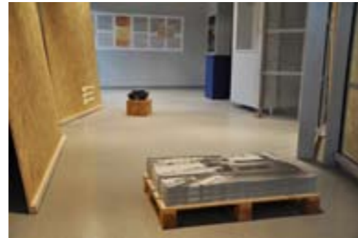
Ausstellungsansicht „Arisierung in Leipzig. Verdrängt. Beraubt. Ermordet“, Schindlermuseum Krakau, 2009